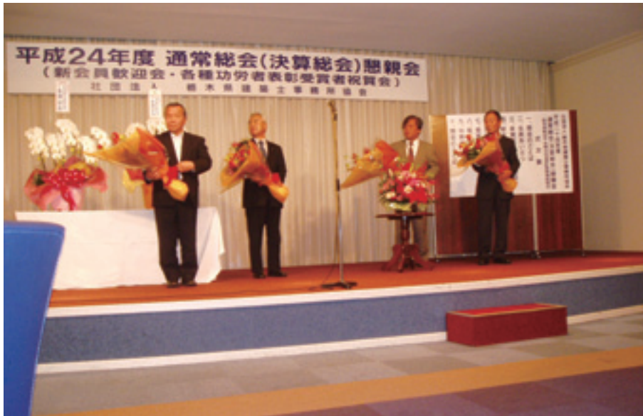
23 年度各種表彰受賞者